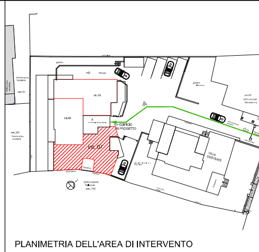
PLANIMETRIA DELL'AREA DI INTERVENTO