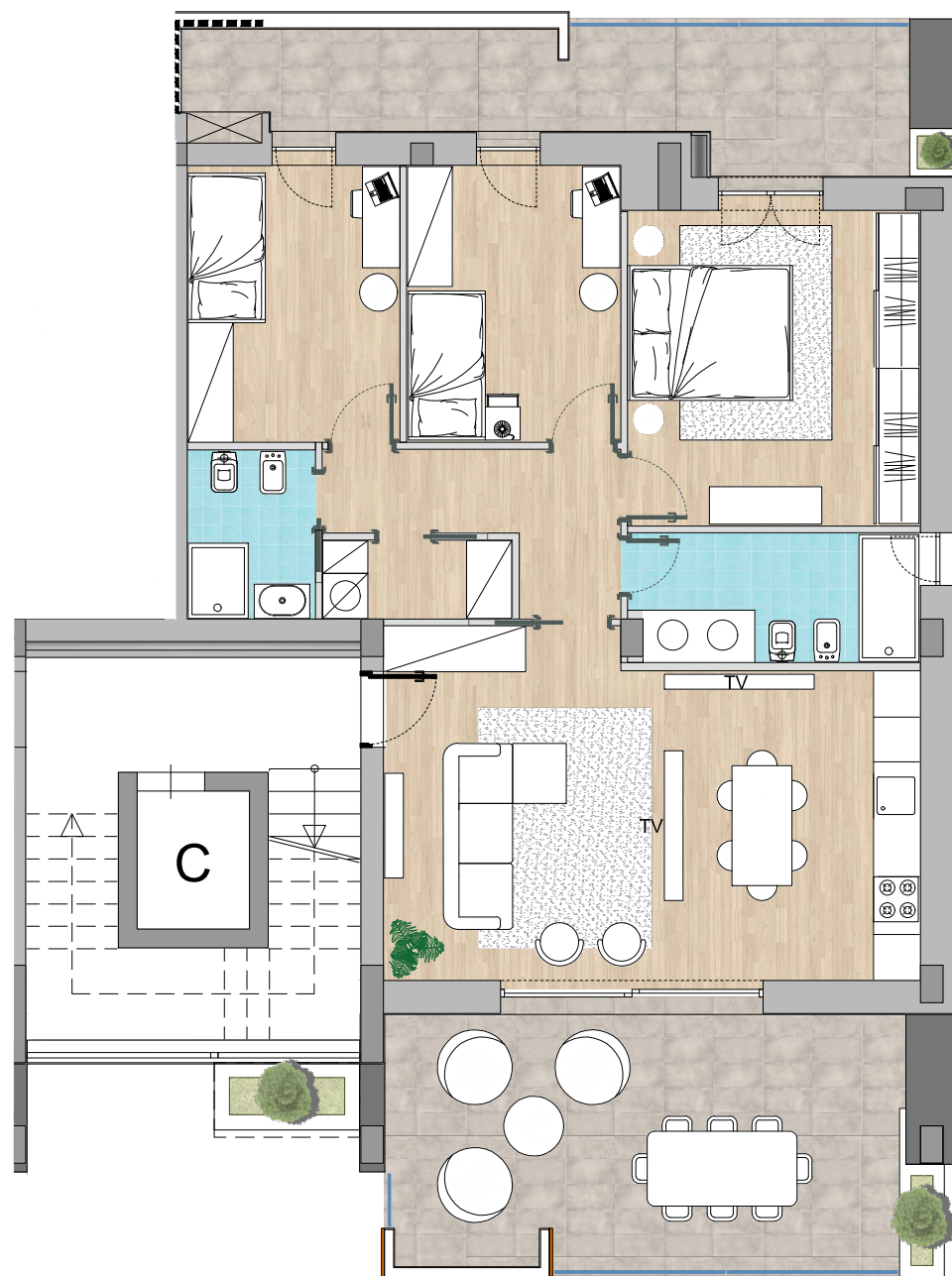
Pianta arredata - scala 1:100